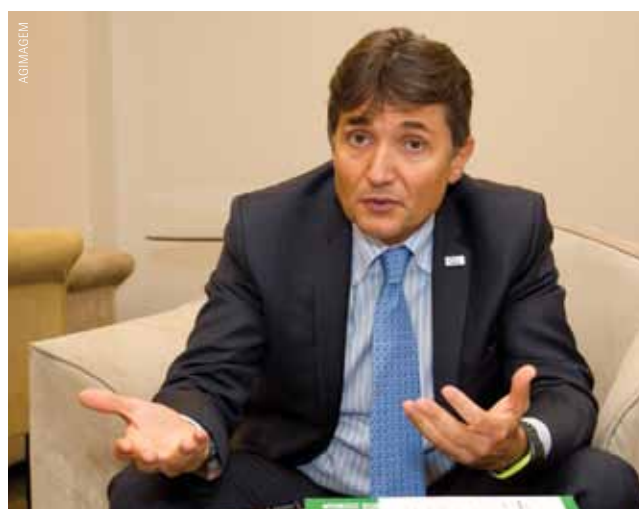
AGIMAGEM GIANCARLO ATTOLINI

Para tanto, alguns desafios apontados pelas firmas